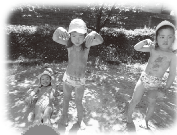
ほっこり つぐやき

絵の具で色水づくり 子ども「できた!ストロベリーの味!」 保育者「ストロベリーの味?」 子ども「これ英語でストロベリーっておじいちゃんがいってりました!!!」