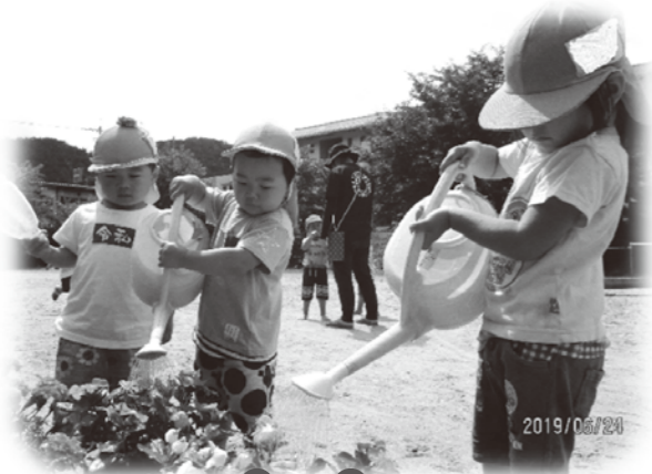
子どもの つぐやき

お気に入りのレンゲを持ったまま布団に入ったCちゃん。 暑くて寝つけずゴロゴロ… 保育者「暑い?今日は暑いよね〜」 すると!!Cちゃんレンゲに 「ふうーふうー」と息を吹きかけました。ままごと遊びで 食べる真似が上手だから、暑いが熱いと思ったんですね。