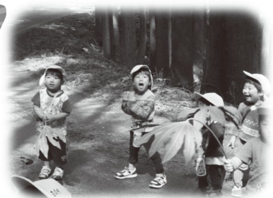
☆ヤツデの葉っぱを見て 子ども「怪獣の足跡みたい!!」