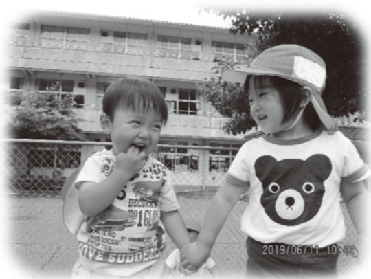
おもしろ つぐやき

光化学オキシダント発生の知らせが来ました さっそく子ども達に説明 保育者「お外に悪いもんがとんでるって!!」 子ども「え?わらいぐま??」