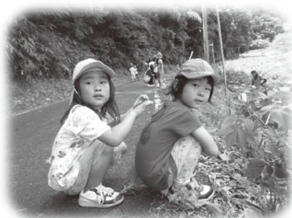
☆友だちの服に葉っぱを貼り 「○○ちゃんおにあいですわ〜!」 とニコリ!

☆なめくじを見て… Aちゃん「カタツムリだー!!」 Bちゃん「カラないじゃん!?!」 Cちゃん「落としたいんじゃない??」 Dちゃん「どこにあるかなあ〜探してあげよう!!」