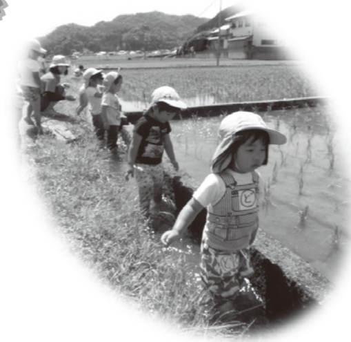
ほっこり つぐやき

ふたの間隙から逃げたカタツムリ… こども「先生!カタツムリがおらん!!」 と探していると…絵本の上にカタツムリ発見!! 子ども「先生!カタツムリが絵本読んでる」 保育者「カタツムリも絵本読みたかったんだね!!」